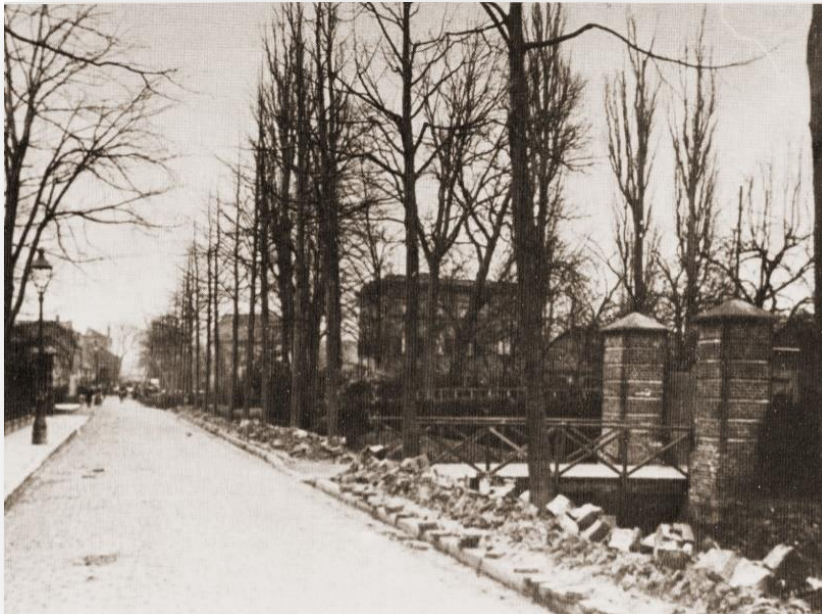
De Langen Dijk, zoals de Vestdijk vroeger heette, omstreeks 1930. Rechts op de achtergrond Huize Ravensdonk. Rechts daarvoor de achterzijde van de tuin van de zusters met een eigen toegang via een bruggetje over de Vest.

Enkele tientallen meters rechts van de poort lag de begraafplaats van de zusters.