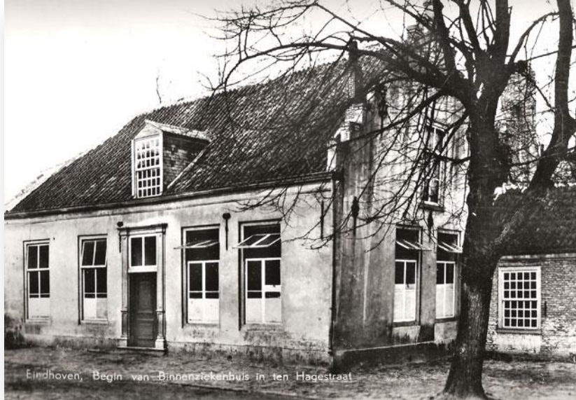
In dit pand aan de Ten Hagestraat begon het Binnenziekenhuis.

Eene afzonderlijke begraafplaats in het gesticht van liefde is op eigen grond en op behoorlijken afstand van de bebouwde kom der Gemeente geplaatst; op deze begraafplaats worden alleen de lijken van Religieuzen uit het gesticht begraven. 2